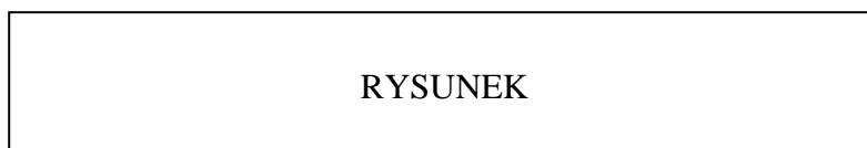
Rys. 23. Fragment schematu organizacyjnego firmy GMC Źródło: R. Jurek Zarządzanie personelem. PWR, Oława 1998, s.9